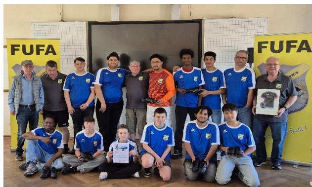
Spendenübergabe Inklusionssport in Worms