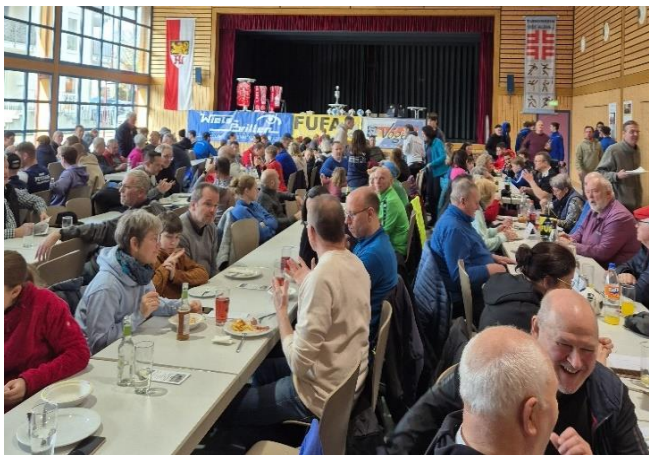
Gemütliches Beisammensein: Winterwanderung 2025 in Albig